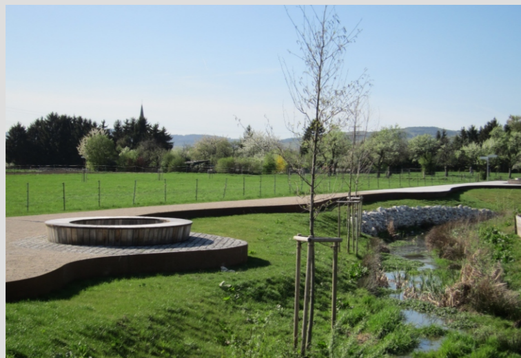
Neu gestalteter Rehlingsbach