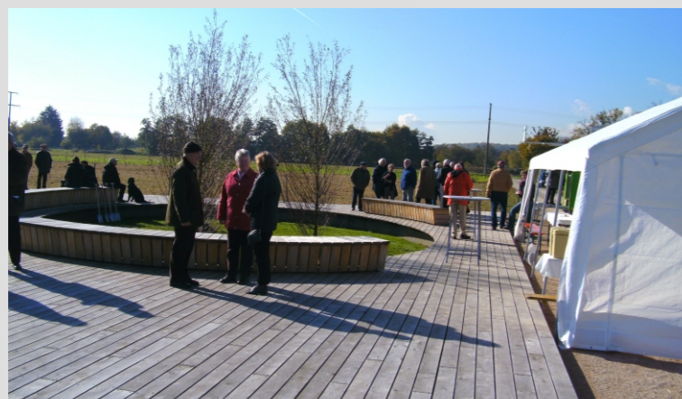
Einweihung Oktober 2010